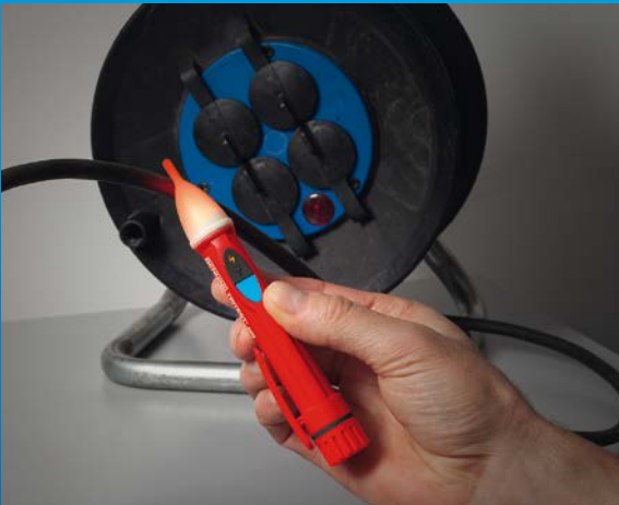
Auffinden von Kabelbrüchen an isolierten und unter Spannung stehenden Leitungen mit TRITEST® easy