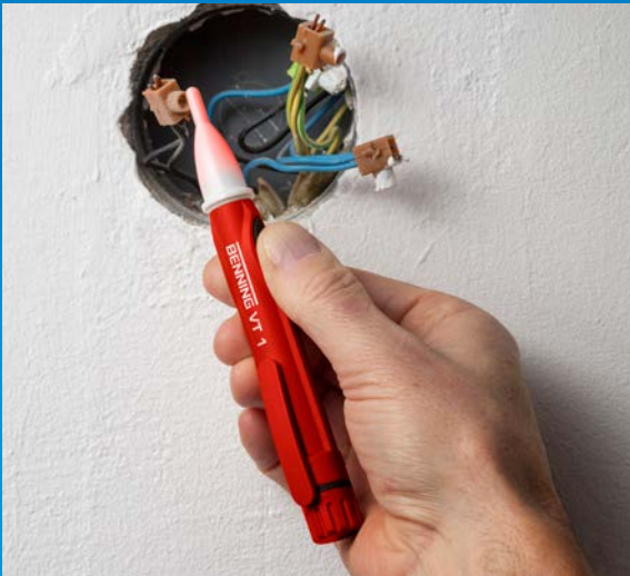
Phasenprüfung an Abzweigdose mit BENNING VT 1