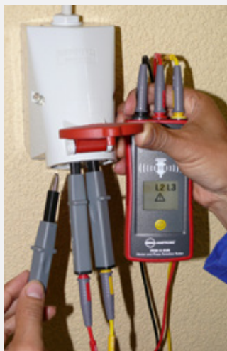
Überprüfung einer CEE-Drehstromsteckdose