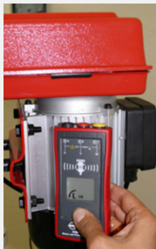
Berührungslose Motordrehrichtungsanzeige bei laufendem Motor