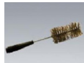
PAT-BRUSH Bürstensonde 4 mm Stecktechnik