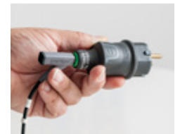
Adapter-PE für Schutzleiter