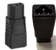
PA-1 Adapter Kaltgeräte auf Klebblatt (IEC C6-C13)