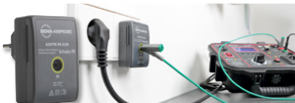
ADPTR-PE-EUR Socket Check Adapter Schuko PE