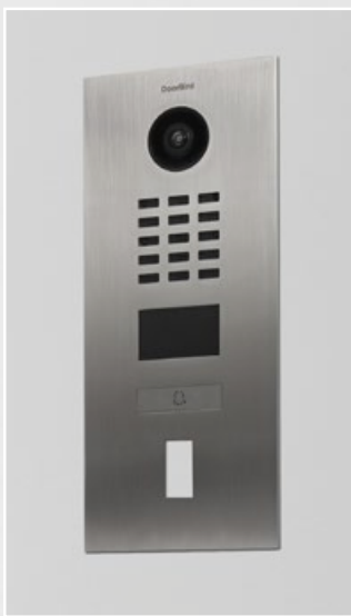
ekey Fingerabdruckleser Modul nicht im Lieferumfang enthalten.