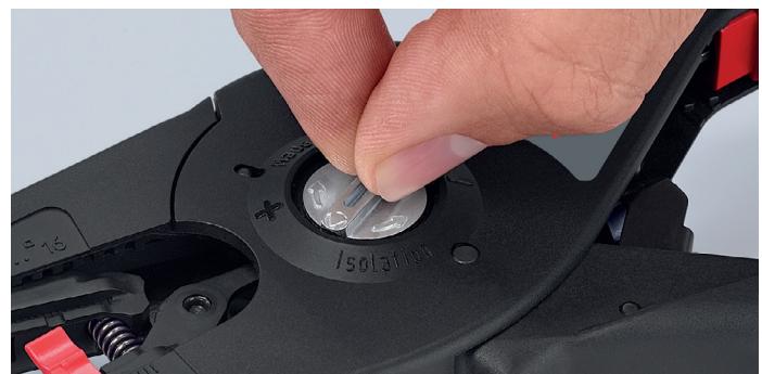
Bei vielen speziellen Anforderungen, etwa besonders harten oder weichen Isolationsmaterialien, erlaubt das Verstellrad mit fühlbaren Rastpositionen die optimale Feinjustierung