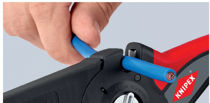
Mit Kabelschneider an der Oberseite bis 16 mm 2