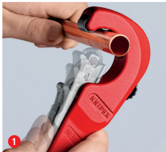
1 Die neue Leichtigkeit des Schneidens: geöffneten KNIPEX TubiX® Rohrabschneider ansetzen ...