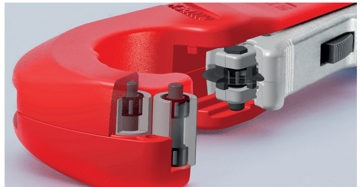
Das Schneidrad und die vier Führungsrollen laufen dank hochwertiger Nadellager beim Schneiden praktisch ohne störende Reibung – schneidet Edelstahlrohre besonders leicht