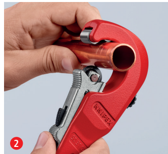
2 Schneidrad mit QuickLock-Einhandschnellverstellung ans Rohr schieben: schnelle Einstellung an unterschiedliche Rohrdurchmesser ...