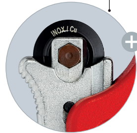
Das nadelgelagerte und abgefederte Schneidrad aus hochwertigem Kugellagerstahl ist leicht wechselbar