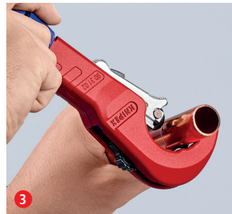
3 Durch Drehung schneiden und dabei mit dem ergonomischen blauen Drehknäuf nachstellen ...