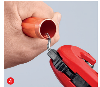
4 Und fertig! Bei Bedarf lässt sich die Schnittstelle mit dem ausklappbaren Entgrater glätten – mit überraschend geringem Kraftaufwand