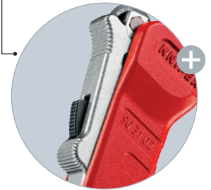
Durch die Einhandschnellverstellung kann das abgefederte Schneidrad an den Durchmesser des Rohres herangeschoben und fixiert werden