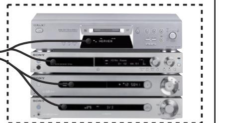
HDD-RECORDER - SET-TOP BOX - DECODER - AUDIO