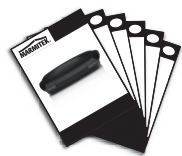
1x User manual