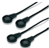
2x IR extender cable, 300 cm with 2 LEDs each