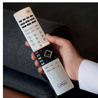
Mit der edlen Fernbedienung RM19, die über eine Echtmetalloberfläche aus gebürstetem Aluminium verfügt, können Sie intuitiv und komfortabel bedienen.