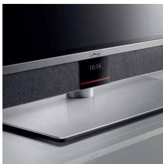
Ein stabiler, drehbarer Tischfuß aus gebürstetem Aluminium rundet das hochwertige Erscheinungsbild perfekt ab.

Mit dem streng limitierten Sondermodell AURUS silverline in 48 Zoll anlässlich der Fußball-Weltmeisterschaft 2026 setzt Metz ein starkes Statement: Das edle Silberdesign hebt ihn stilvoll von der uniformen Farbwelt gängiger Fernseher ab und macht ihn zum Blickfang in jedem Wohnraum. Ausgestattet mit modernster OLED-Technologie und 33 Millionen einzeln ansteuerbaren Subpixeln liefert der TV überwältigende Bilder mit perfektem Schwarz, brillanter Farbdarstellung und beeindruckenden Kontrasten - unterstützt durch aktuelle HDR-Standards. Für satten Klang sorgt das leistungsstarke MetzSoundPro-System mit Zwei-Wege-Bauweise, Bassreflex-Kanal und sechs nach vorne abstrahlenden Lautsprechern, dezent verborgen hinter hochwertigem Akustikstoff in dezentem Silbergrau. Umfangreiche Schnittstellen, Twin-Multi-Tuner, WLAN und Bluetooth machen den AURUS silverline zu einem vielseitigen Partner im Home-Entertainment. Gesteuert wird er komfortabel mit der RM19 Fernbedienung aus gebürstetem Aluminium. Als exklusiven Mehrwert haben wir das Sondermodell zusätzlich mit einem integrierten Digitalrecorder mit 1-TB-Festplattenkapazität ausgestattet. So verpassen Sie dank komfortabler Timeshift- und Aufnahmefunktion garantiert kein Tor*.