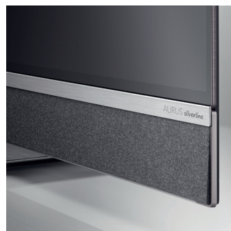
Akustikvlies in dezentem Silbergrau mit Zierblende aus gebürstetem Aluminium in Silber.