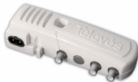
▲ NT12F (5501)