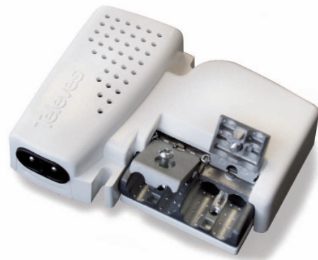
▲ PSU242PICO (5795)