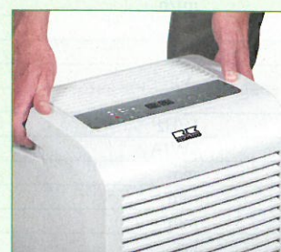
Leicht zu transportieren