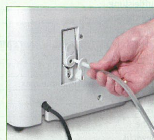
Eingebaute Kondensatpumpe, steckerfertig