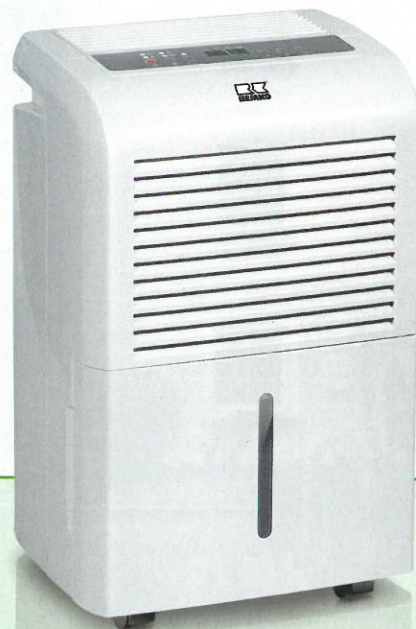
REMKO ETF 360

Serie ETF Trocknen und Entfeuchten zuverlässiger als Sonne und Wind