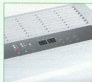
Übersichtliches Bedientableau mit Digitalanzeige