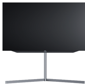
bild v.65 dr+: B* x H x TP x TG/FP = 145,7 x 86,0 x 6,8 x 9,9 bild v.55 dr+: B* x H x TP x TG/FP = 123,6 x 73,6 x 6,8 x 9,9 neigbare Montage