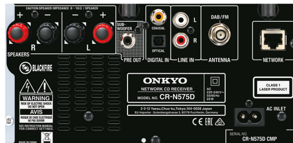
CR-575D (Silber) Rückansicht

Im Rahmen der kontinuierlichen Produktverbesserung behält sich Onkyo das Recht vor, technische Daten und Gestaltungsmerkmale ohne Vorankündigung zu ändern. Informationen zu DTS-Patenten finden Sie unter http://patents.dts.com . Informationen zu DTS-Patenten finden Sie unter http://patents.dts.com . Hergestellt unter Lizenz von DTS, Inc. DTS, Play-Fi, das Symbol und Play-Fi sind eingetragene Marken von DTS, Inc. © DTS, Inc. Alle Rechte vorbehalten. Die Bluetooth®-Wortmarke und -Logos sind Eigentum von Bluetooth SIG, Inc. IOS ist eine Marke, an der Cisco in den USA und anderen Ländern die Rechte hält. iPad, iPhone, iPod und Mac sind eingetragene Marken von Apple Inc. in den USA und anderen Ländern. Kindle, Fire und alle zugehörigen Logos sind Marken von Amazon.com, Inc. oder seiner verbundenen Unternehmen. Wi-Fi® ist eine eingetragene Marke der Wi-Fi Alliance. Das Wi-Fi CERTIFIED-Logo ist ein Gütesiegel der Wi-Fi Alliance. Spotify und das Spotify-Logo sind eingetragene Marken der Spotify Group in den USA und anderen Ländern. Produkte mit dem Hi-Res Audio-Logo erfüllen den Hi-Res Audio-Standard der Japan Audio Society. Das Hi-Res Audio-Logo wird unter Lizenz der Japan Audio Society verwendet. FireConnect™ ist eine Technologie auf Basis von Blackfire und wird von der Blackfire Research Corp., USA bereitgestellt. Onkyo Controller ist eine Marke der Onkyo Corporation. Alle anderen Marken und eingetragenen Marken sind Eigentum der jeweiligen Inhaber.