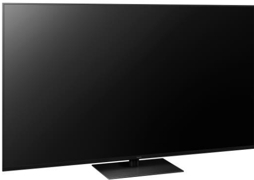
75" Modell ist mit einen eckigen Metall-Standfuß ausgestattet. Kein Switch Design.