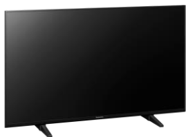
43" Modell: Kein Switch Design.