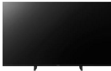
65" - 49" Modelle sind mit Switch Design ausgestattet, Wahlweise Fußposition innen oder außen mit Erhöhung für eine Soundbar.