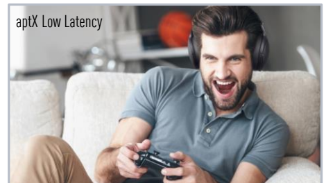
aptX Low Latency