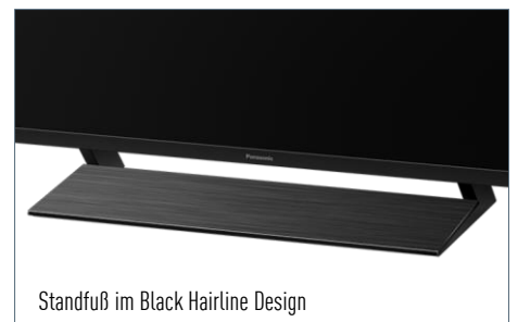
Standfuß im Black Hairline Design