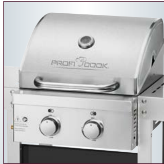
Hochwertige Edelstahlfront und -haube