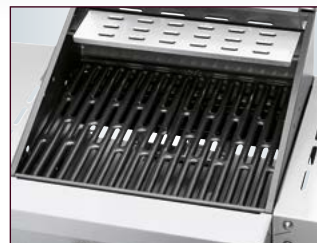
Geteilte Grillfläche: 2 emaillierte Grillroste