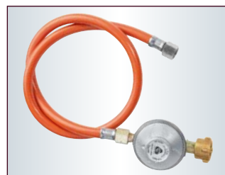
Inkl. Gasdruckminderer und Gas- schlauch