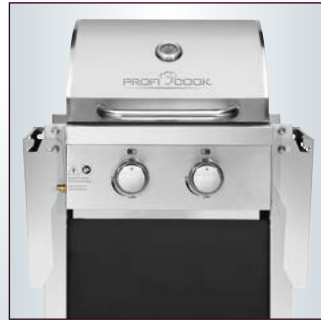
Klappbare, platzsparende Seitentische – auch ideal für den Balkon geeignet (ca. 61 cm breit)