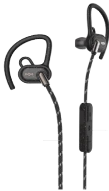
SB: Signature Black

Kabellos und outdoortauglich – unsere neuen UPRISE Bluetooth In-Ears machen garantiert jedes Abenteuer mit. Egal ob drinnen oder draußen, diese Kopfhörer beweisen mit der Schutzklasse IPX5 unschlagbares Durchhaltevermögen und besten Sound bei jeder Aktivität. Passend zur Leitlinie #Materialsmatter besteht der UPRISE aus Naturfasern, dem einzigartigen REGRIND™ Silikon und recycelbarem Aluminium.