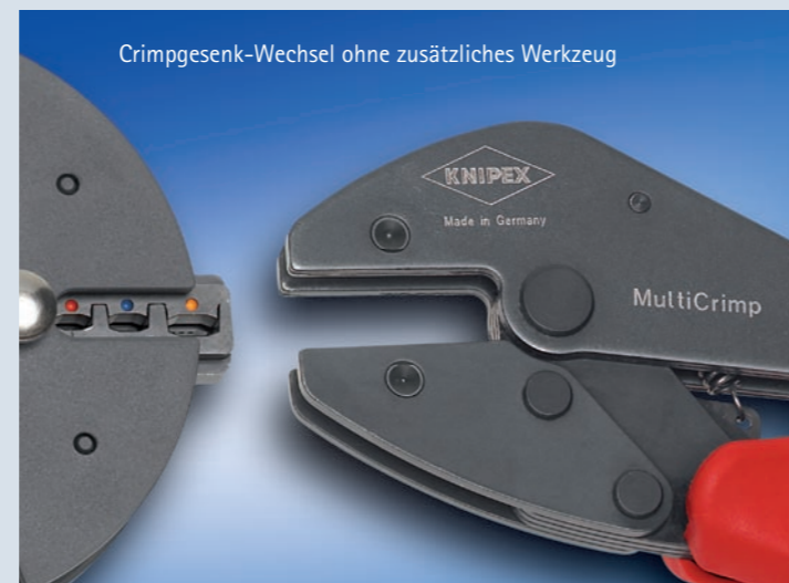
Crimpgesenk-Wechsel ohne zusätzliches Werkzeug

Für die gängigsten Crimpanwendungen benötigt der Elektriker im mobilen Service-Einsatz bisher mindestens 3 verschiedene Crimpzangen. Das neue MultiCrimp-System liefert jetzt die Lösung für den professionellen Crimpanwender: Set bestehend aus Zange zusammen mit Magazin und wahlweise 3 oder 5 Wechselseinsätzen für unterschiedliche Anwendungen vor Ort.