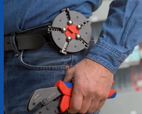
Rundmagazin mit Gürtelclip: Wechseleinsätze immer griffbereit