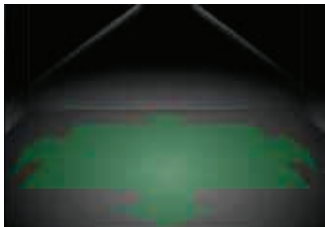
Micropoint 2 O AT Raumausleuchtung mit symmetrischer Optik