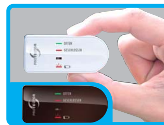
FENSTER SENDERGEHÄUSE ZUSÄTZLICH IN BRAUN BEIGEFÜGT