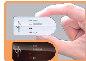
FENSTER SENDERGHÄUSE ZUSÄTZLICH IN BRAUN BEIGEFÜGT