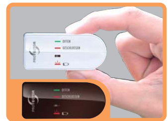
FENSTER SENDEERGEHÄUSE ZUSÄTZLICH IN BRAUN BEIGEFÜGT