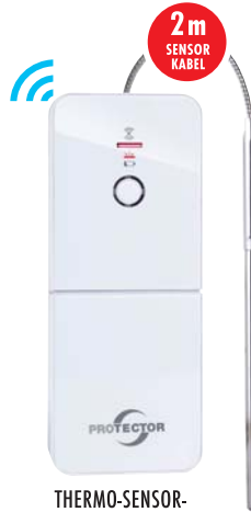
THERMO-SENSOR-EINHEIT FÜR OFENROHR