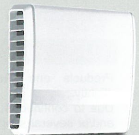
e 90 und Ne xt Zweikanal- Außenblende 1/EGA