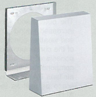
Außenhaube Weiß 1/HWE

Produkte und deren Abbildungen können leicht variieren. Aufgrund ständiger Weiterentwicklungen und/oder mehrerer Lieferanten für z.B. Rohmaterialien können u.a. Farben leicht variieren oder auf Prospekten unterschiedlich dargestellt werden.