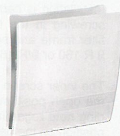
Innenblende Glas 9/IBG