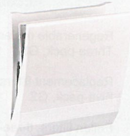
Innenblende Kunststoff 9/IBK