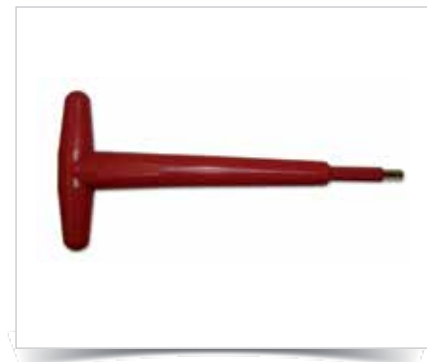
Abb.: Isoliertes Werkzeug ZK4R