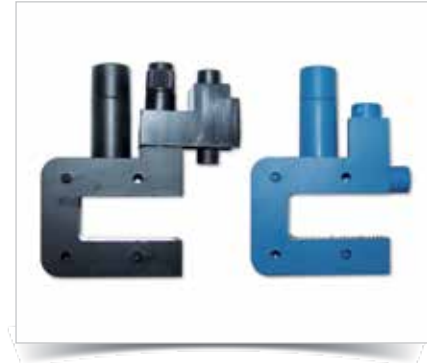
Abb.: ZK4S und ZK 4B