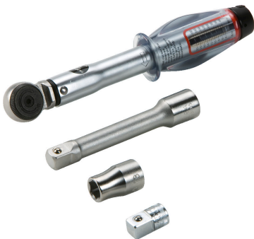
KES MA WKZ SET, Werkzeugset für KES MA