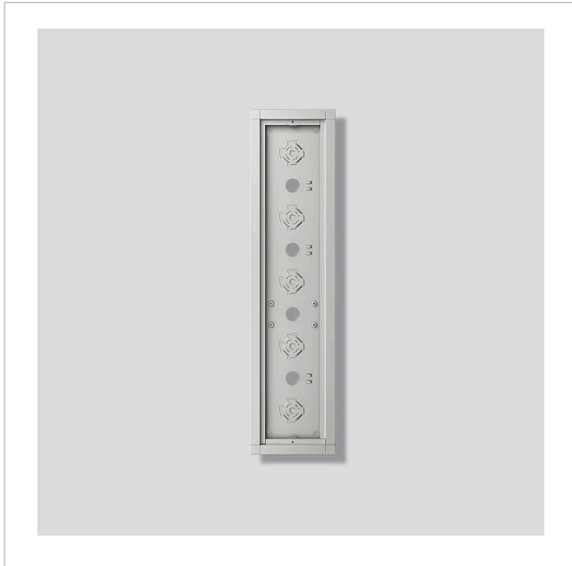
Gehäuse-Aufputz GA 612-5/1-01 SM