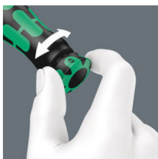
Mit hör- und fühlbarem Einrasten bei Erreichen der Skalenwerte.