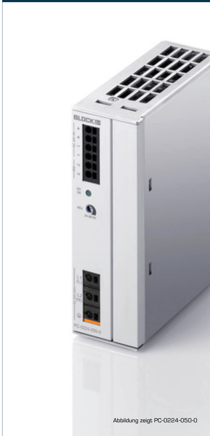
Abbildung zeigt PC-0224-050-0