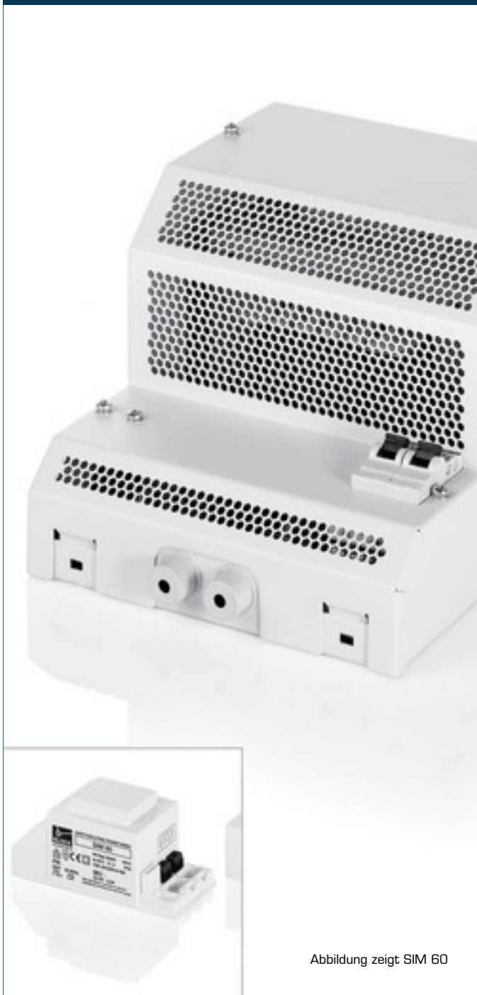
Abbildung zeigt SIM 60