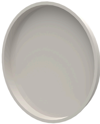
HFR VD, PE-Deckel