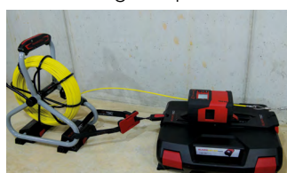
RM35 mit Montageplatte-Systemkoffer, Glasfasereinziehsystem Ø 4,5 mm