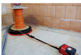
RM35 mit Gurt und Clip-System an XB 500 befestigt