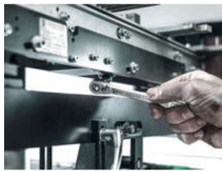
Zyklus Metal Switch

Aufgrund der immer enger werdenden Arbeitsbereiche wird es auch für Knarren immer enger. Dieses Problem hat Wera gelöst. Daher haben sich unsere Produktentwickler besonders intensiv in enge Arbeitssituationen eingedacht. Herausgekommen ist die extrem schlanke und robuste Knarre Zyklus Metal mit langem Hebel. Wenn der Richtungswechsel schnell gehen soll, ist die Knarre Zyklus Metal Switch das richtige Werkzeug.