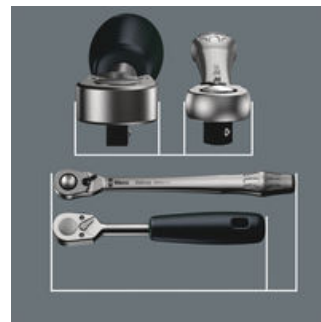
Zyklus Metal Switch

Extrem schlank. Langer Hebel. Geschmiedete Vollmetallknarre aus Chrom-Molybdän.