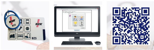
Abbildung: Großes Gehäuse